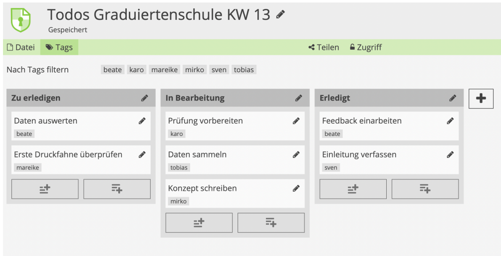
Abb 1: Gemeinsamer Auf- gabenbereich auf cryptpad.fr

Um den Austausch zu erleichtern und auch um Ergebnisse zu sichern, wird Mirko auf cryptpad.fr einen Arbeitsbereich erstellen.